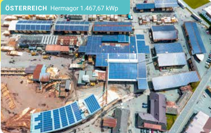
ÖSTERREICH Hermagor 1.467,67 kWp