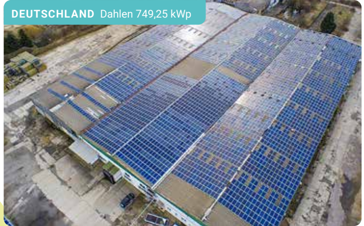
DEUTSCHLAND Dahlen 749,25 kWp