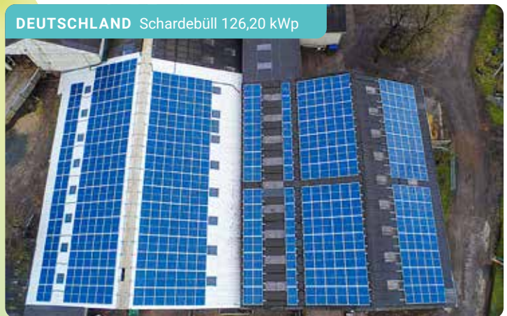
DEUTSCHLAND Schardebüll 126,20 kWp