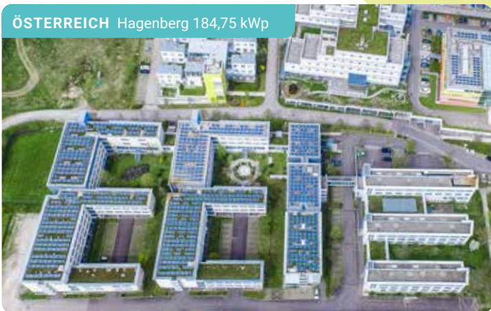
ÖSTERREICH Hagenberg 184,75 kWp