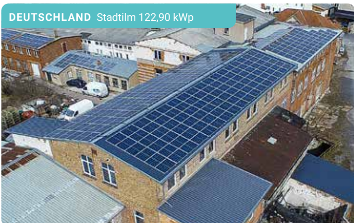
DEUTSCHLAND Stadtilm 122,90 kWp