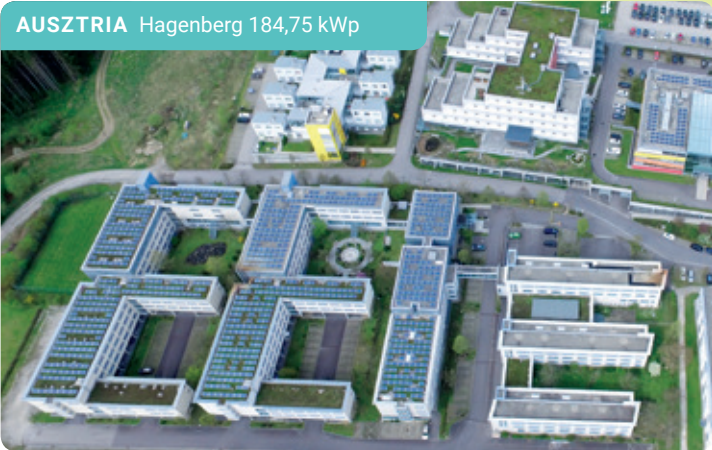
AUSZTRIA Hagenberg 184,75 kWp