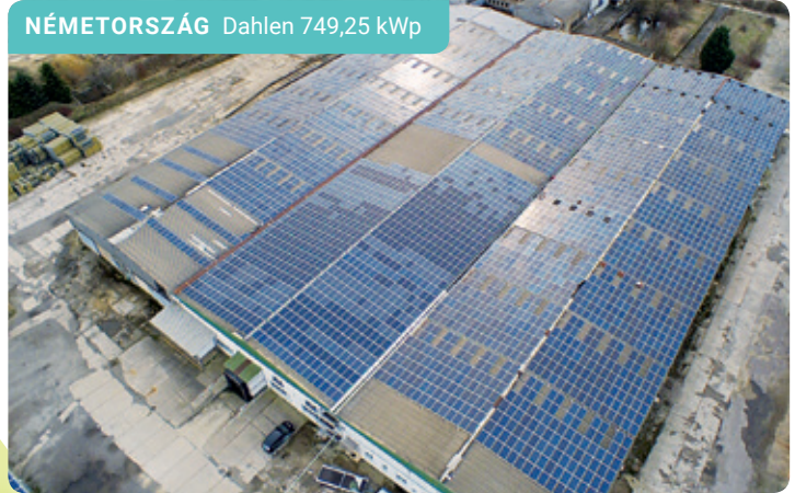
NÉMETORSZÁG Dahlen 749,25 kWp