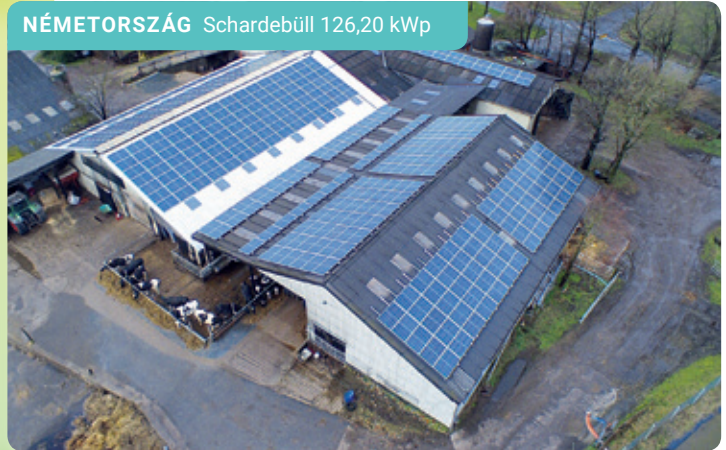
NÉMETORSZÁG Schardeüll 126,20 kWp