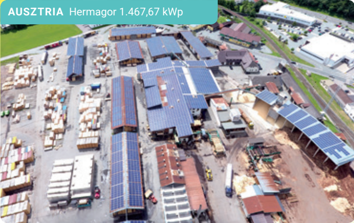
AUSZTRIA Hermagor 1.467,67 kWp