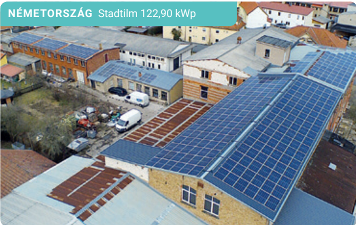
NÉMETORSZÁG Stadtilm 122,90 kWp